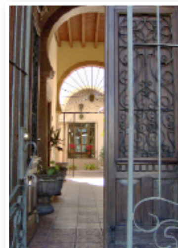
"CASA VIEJA" de Ana Ríos, alumna de Fotografía del programa CULTUREST.

ciones de artes visuales y 25 museográficas. En estas actividades participaron alrededor de 120 mil personas.