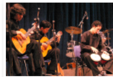
Grupo Stacatto durante su presentación en el teatro Emiliana de Zubeldía.