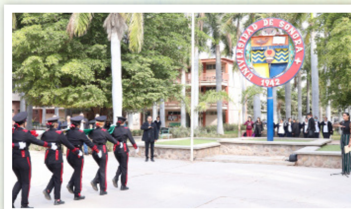
En los campus Caborca y Navjoa se realizaron honores a la bandera el día 24 de febrero.