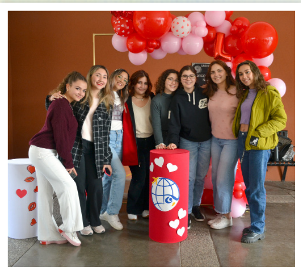
Con diversas actividades los universitarios del campus Hermosillo celebraron el 14 de febrero.