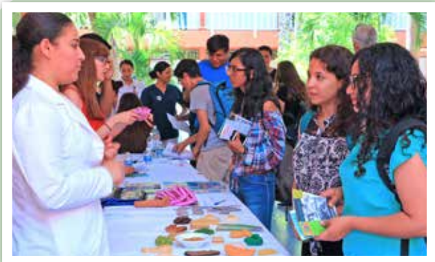
La educación en salud también es itinerante.