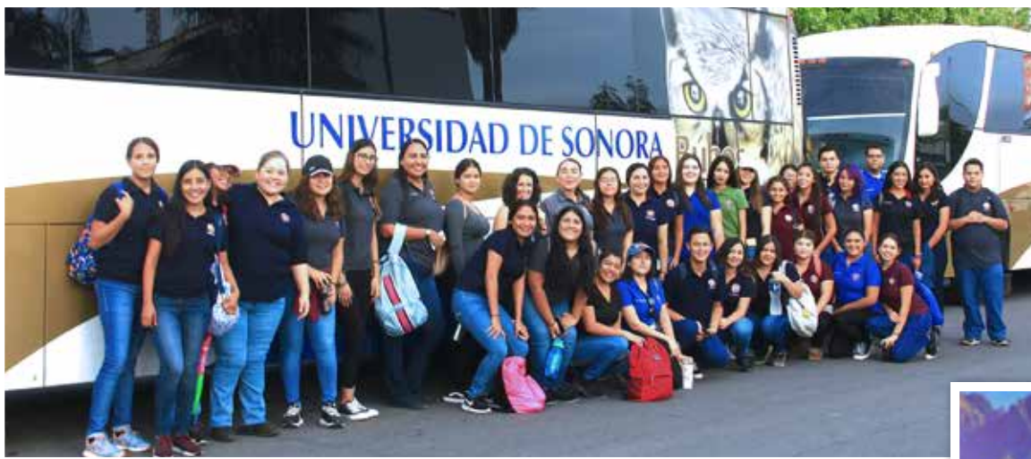
Rumbo a las visitas comunitarias.