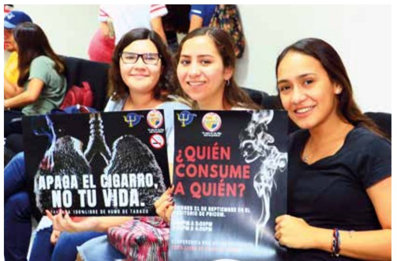
Apoyando la campaña.