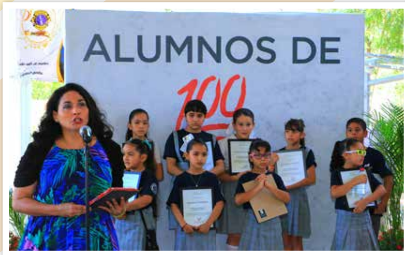
Himno universitario también para la primaria.