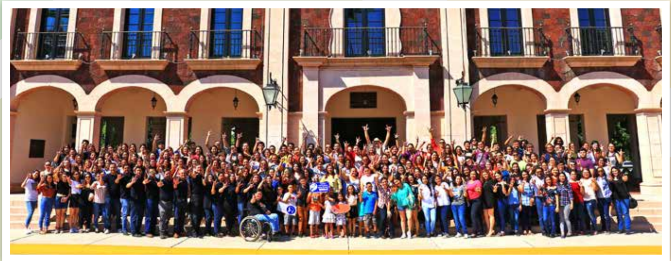
Celebrando el Día Internacional de Lengua de Señas.