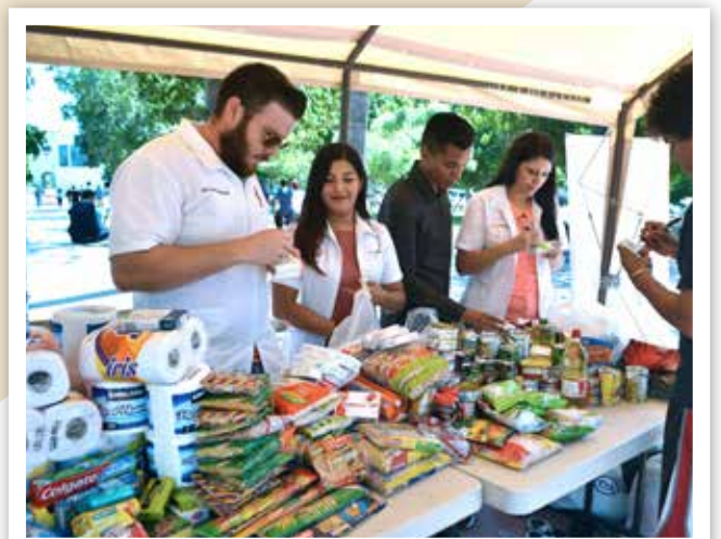
La Unison solidaria con afectados por las lluvias en Sinaloa.