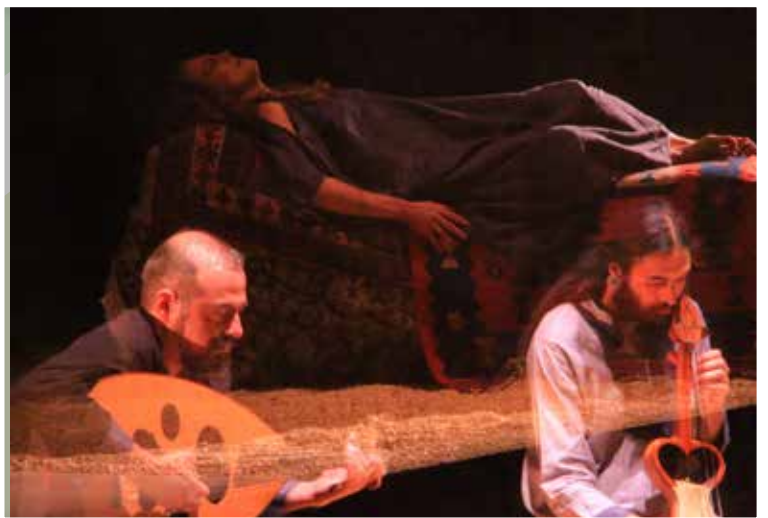
Medea...toda una representación