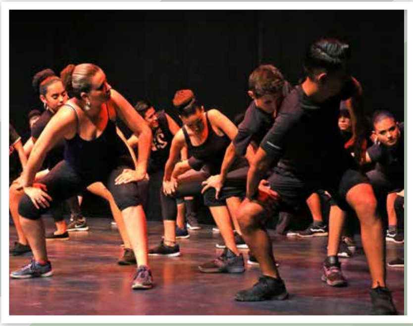
Una muestra de Tradición Mestiza.