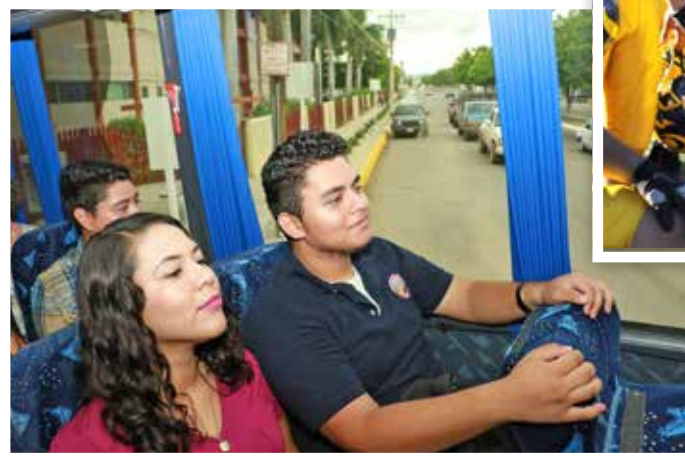
Estrenan camión los búhos de Navojoa.