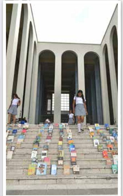
Eligen su libro en mañana de siembra.