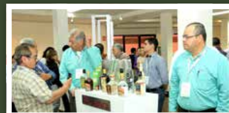
También hubo exposición de fotografías y productos regionales.