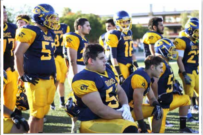
¿Cuál será la siguiente jugada?