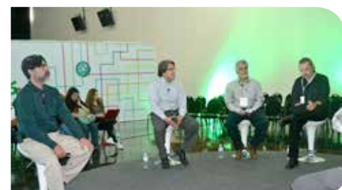
Académicos de la Universidad de Sonora participaron en distintas mesas de trabajo.