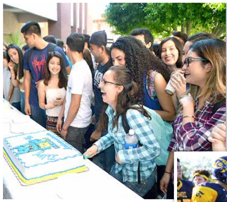
Divertido corte de pastel.