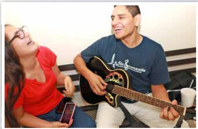
Canto y carcajada en Re.