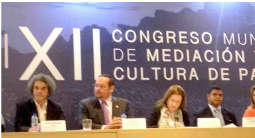
Mesa del presidium del Congreso.

"Los mecanismos alternativos de solución de controversias se alojan ahora en una ley nacional que incorpora las juntas restaurativas al lado de la mediación y la conciliación, lo que nos dice claramente que los conflictos pueden ser solucionados en forma amistosa; que las partes pueden reclamar el poder de resolver su propia controversia y que los disensos pueden tener una solución pacífica", apuntó.