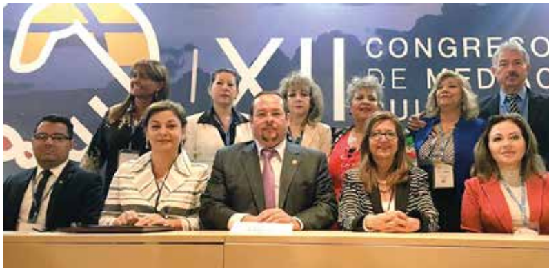
Miembros de la comunidad universitaria acudieron al Congreso Mundial de Mediación, realizado en Bogotá, Colombia.