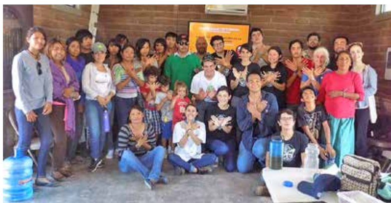
Capacitación en la comunidad comcaac de Punta Chueca.