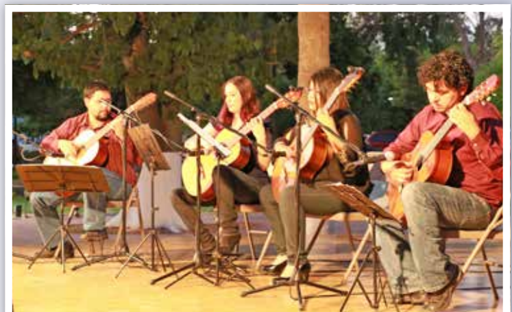
Acordes y notas inundan la Plaza del Estudiante.