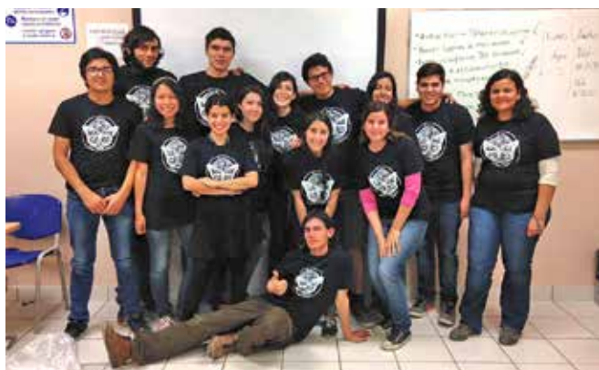
Grupo de estudiantes de Alianza Mariposa Monarca.