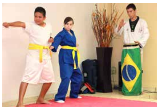
La exhibición de artes marciales de niños y jóvenes de Malala Academia Hermosillo fue en el auditorio del Departamento de Trabajo Social.

oportunidad de ser universitarios, por eso creemos que con el apoyo de la alma mater sonorense podemos bajar esas cifras", resaltó. El convenio firmado el pasado mes de julio convierte a la academia en unidad receptora de prácticas escolares y profesionales, así como la prestación de servicio social y el desarrollo de proyectos de vinculación y extensión universitaria, donde docentes y estudiantes del Departamento de Trabajo Social amplían las posibilidades de aplicar las competencias propias del campo disciplinar. Directivos y académicos universitarios también se han involucrado en el fortalecimiento del programa de permanencia escolar "Sudando por un Futuro Mejor" en Malala Academia Hermosillo.