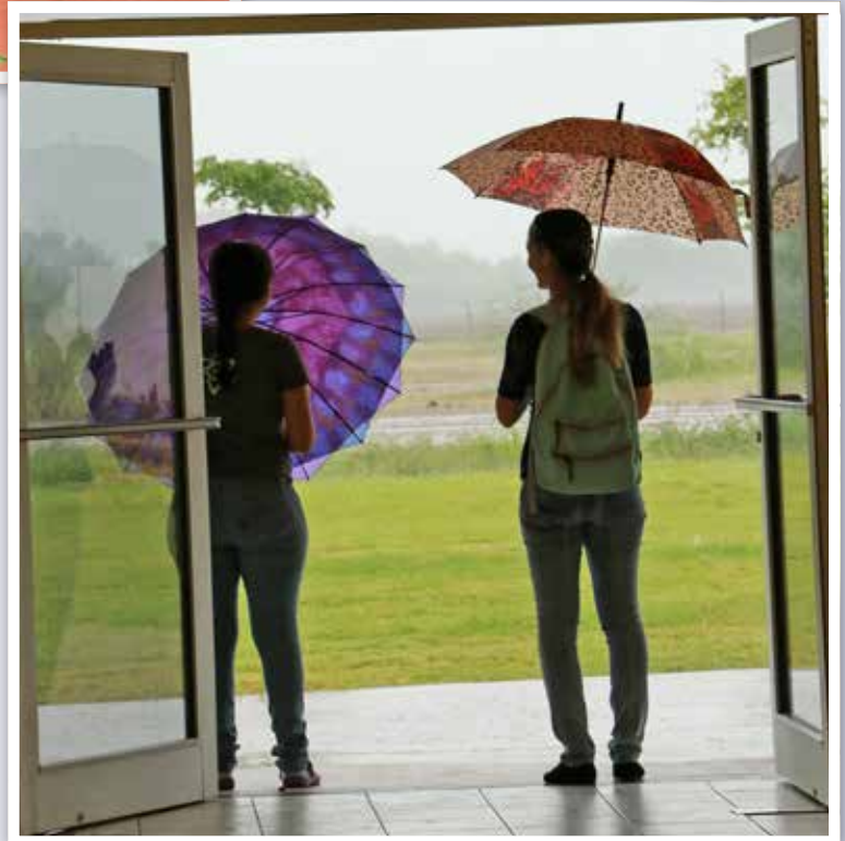
Ni con paraguas se animan.