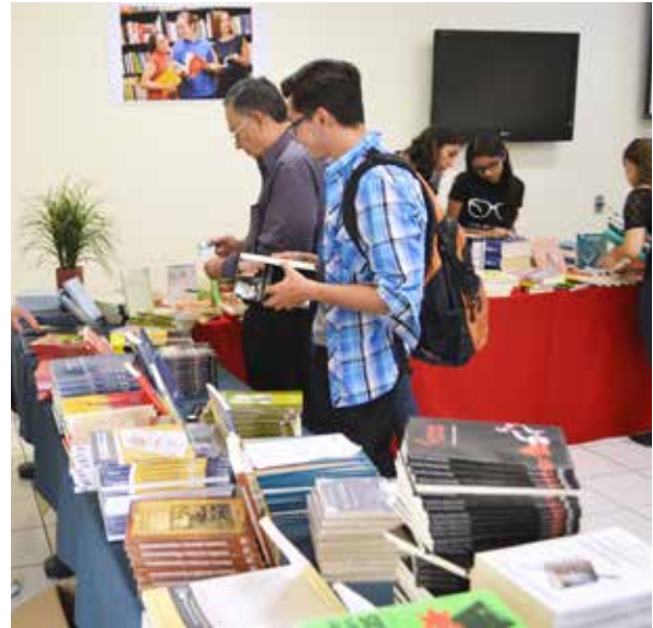
Hubo textos disponibles para venta a precios muy accesibles