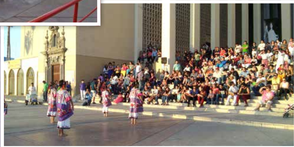
PRESENTACIONES EN EL DÍA MUNDIAL DE LA DANZA.