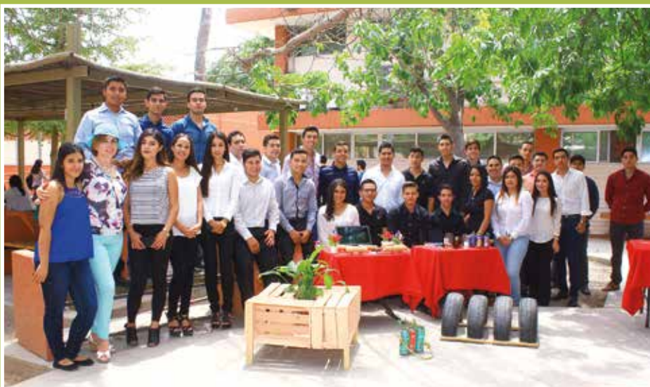
Con diversas actividades se celebró en la Universidad de Sonora el Día Internacional de la Tierra.

Su objetivo último, agregó, es alcanzar cierto nivel de progreso material sin que por ello se comprometa el ambiente, los recursos naturales o la calidad de vida de los seres humanos y demás especies del planeta. Apuntó que en la Universidad de Sonora se cuenta con un programa de gestión ambiental, certificado bajo la norma ISO-14001, y la institución evolucionó ese sistema hasta convertirlo en el Plan de Desarrollo Sustentable, en el que están participando alumnos, maestros, empleados y directivos, dirigidos por un comité que da seguimiento a las acciones y metas que se han planteado dentro del plan, y dependiendo de los resultados, se van evaluando y proponiendo nuevas estrategias, de acuerdo los avances que se obtengan. Es importante identificar dónde impactan las organizaciones, indicó, y en el caso de la Universidad "nos fuimos a las funciones sustantivas, que son la docencia, investigación, vinculación y la administrativa; la idea era identificar qué impactos generábamos por ser una institución de educación superior que forma profesionistas, y ya identificados los impactos se proponen las posibles estrategias a seguir", finalizó.