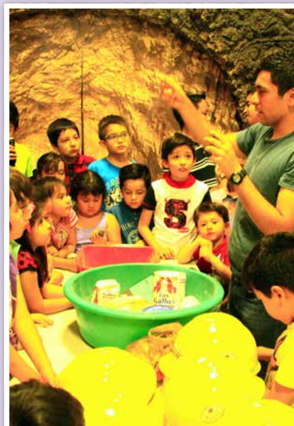
ASOMBRO EN SÁBADOS EN LA CIENCIA.