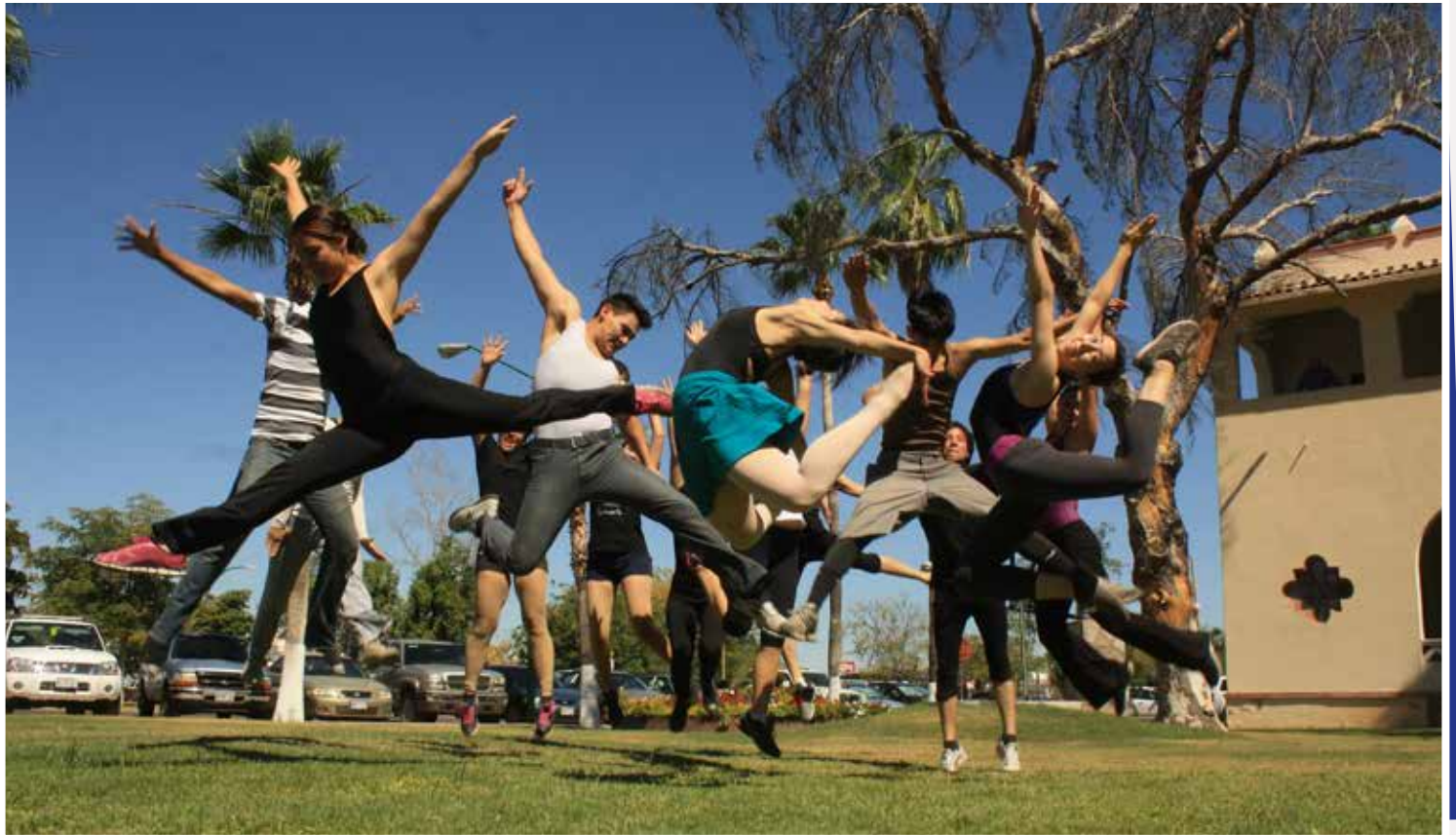
ESTAMPA EN EL DÍA INTERNACIONAL DE LA DANZA.