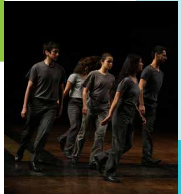
Presentación de jóvenes creadores en el Centro de las Artes.