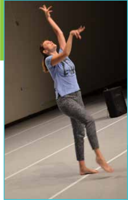
Colectivo Qualquer, de España a la Unison.

Además de las muestras coreográficas, en el festival también programaron intervenciones urbanas, una conferencia internacional, la presentación de un libro, así como seis talleres y una charla pública.