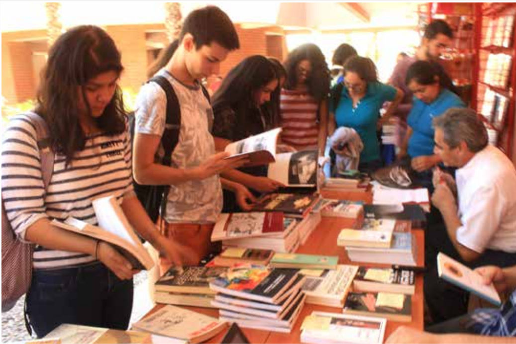
IMPULSAN INTERCAMBIO DE LIBROS EN ARQUITECTURA.