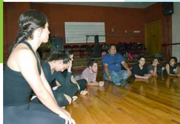
La Universidad de Sonora fue sede de talleres que se ofrecieron en el marco del festival Un Desierto para la danza.