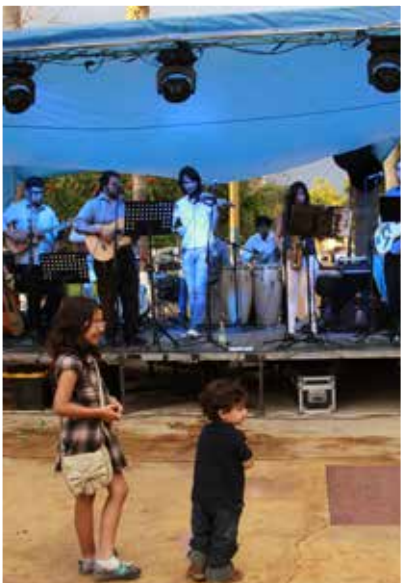
FESTIVAL DE PRIMAVERA CON OLOR A TIERRA MOJADA Y PEQUEÑOS FANS.