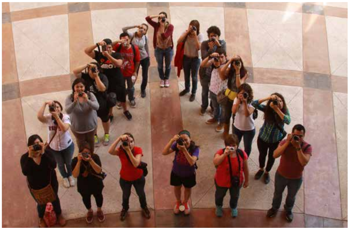
EL ATAQUE DE LALENTE.