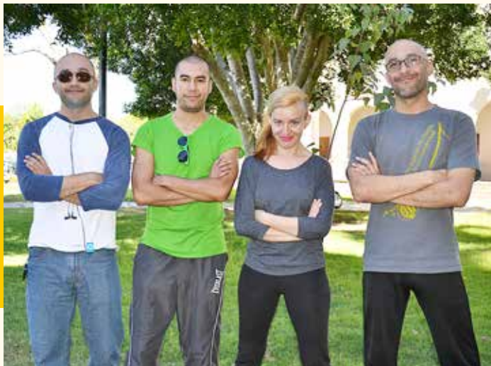
Intérpretes de la coreografía Black Silver .

Le satisface el premio obtenido como equipo, sobre todo porque es un gran resultado que reflejó todas las horas de trabajo previo.