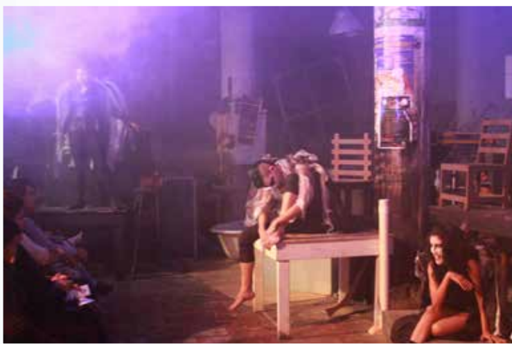
RETAZOS DEL APOCALIPSIS.