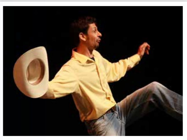
CUENTOS, LEYENDAS Y ANÉCDOTAS DEL PUEBLO.