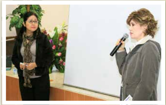
El Departamento de Derecho organizó la Jornada por la Identificación y Prevención de la Violencia de Género contra las Mujeres los días 3,4 y 5 de marzo, que incluyó talleres y charlas.

Con motivo del Día Internacional de la Mujer, la Universidad de Sonora, a través de la Unidad Regional Centro (URC), se sumó a la conmemoración del 8 de marzo, con un amplio programa de actividades bajo el nombre "Mujer. Coincidencia en la diversidad. Palabras, imágenes y reflexiones".