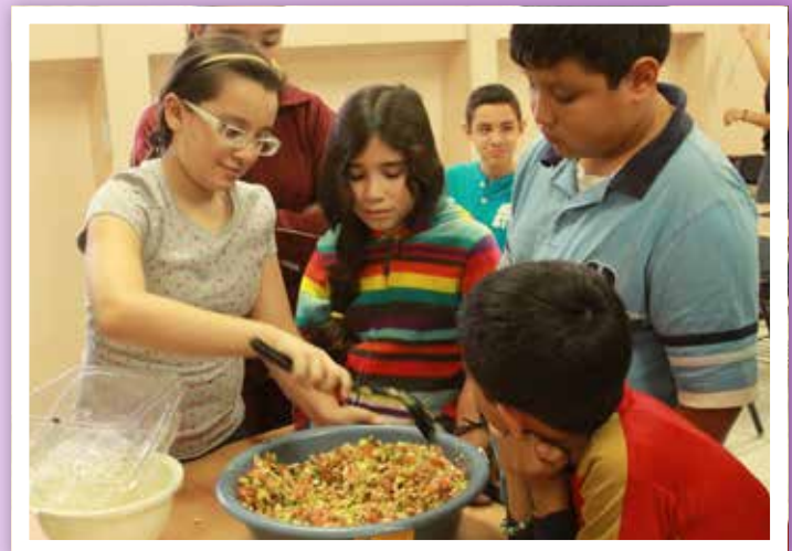
SÁBADO EN LA CIENCIA: CONOCIENDO EL MICROSCOPIO Y PREPARANDO CEVICHE DE HONGO.