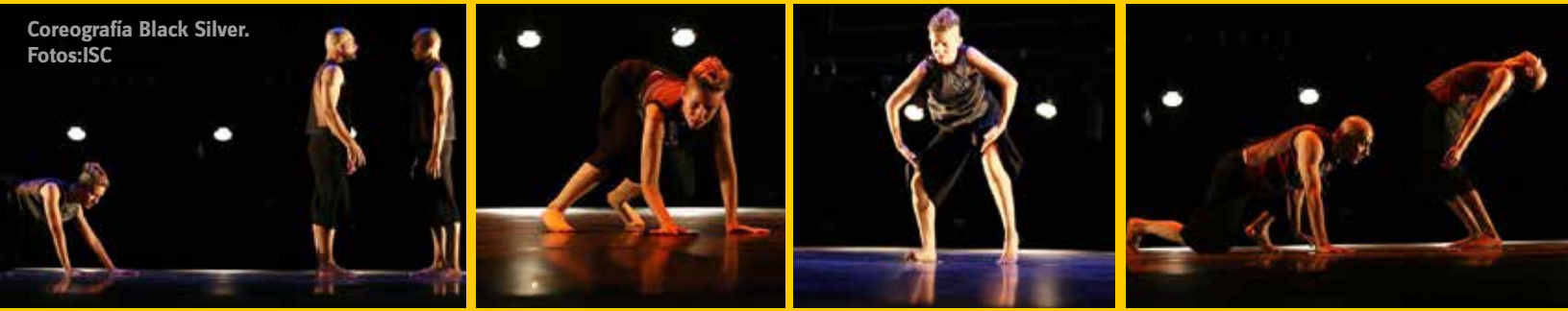
Coreografía Black Silver.

La obra “TOGO: Sistema de referencias”, del coreógrafo Jorge Armando Tirado Motel, se llevó los premios a mejor intérprete masculino y mejor música original, este último reconocimiento se entregó al propio creador, en el XX Concurso Regional de Coreografía Contemporánea.