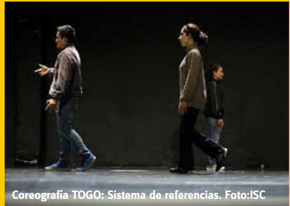
Coreografía TOGO: Sistema de referencias.