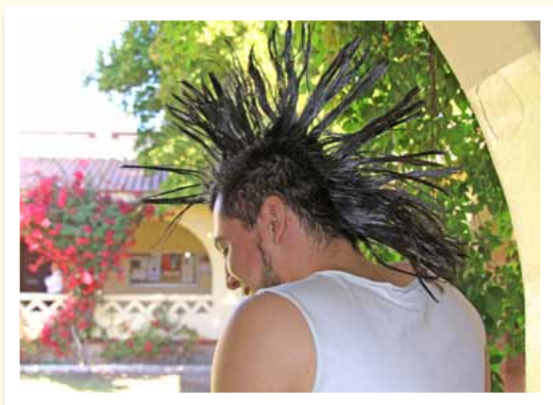
EL ÚLTIMO DE LOS MOHICANOS.