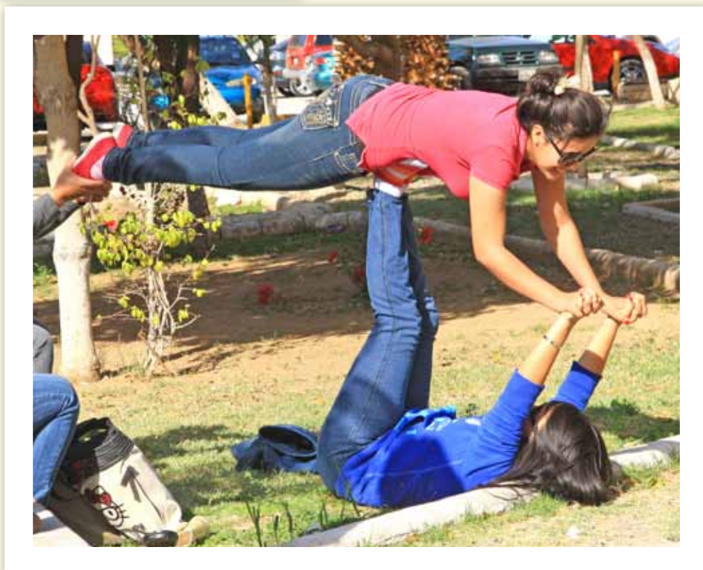
LA AYUDAN A VOLAR.