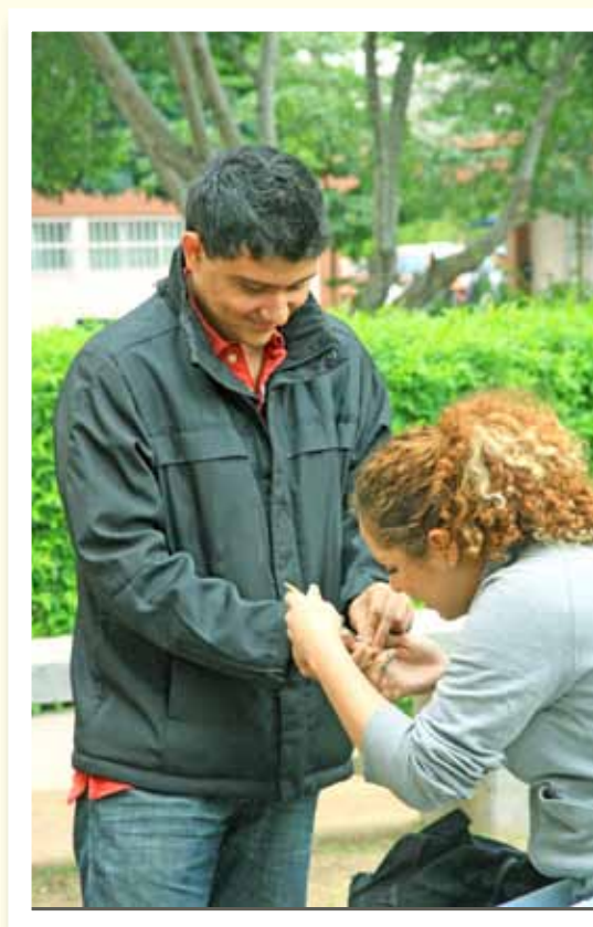
SE SACÓ LA ESPINITA.