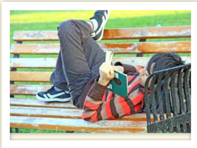
BANCAS BIEN APROVECHADAS.