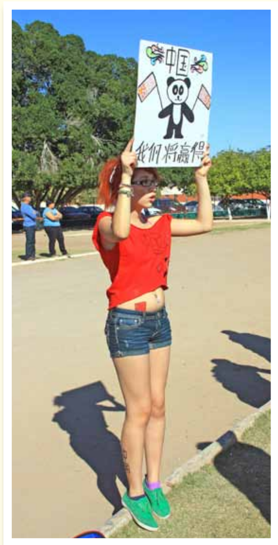
PORRISTA DEL ORIENTE.