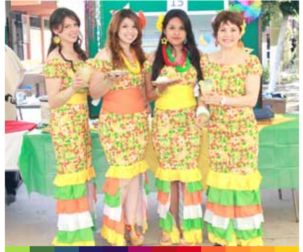
Realizan IV Muestra Gastronómica alumnos de la Licenciatura en Ciencias Nutricionales