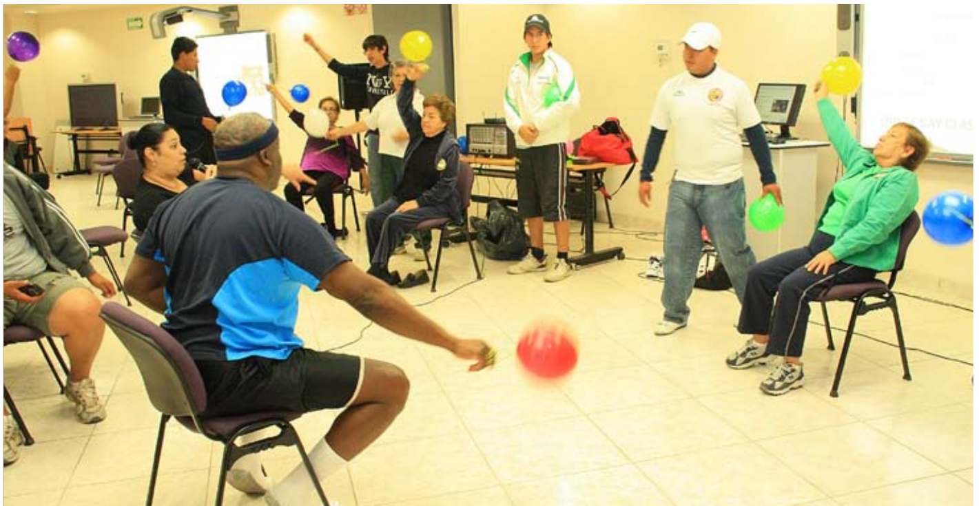
ACTIVACIÓN FÍSICA PARA TODAS LAS EDADES.