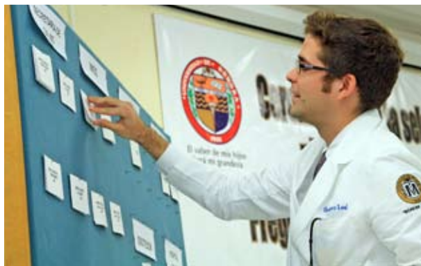
ELIGIENDO EL DESTINO.