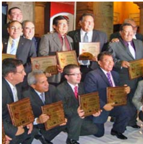
Con otros galardonados.

El galardonado es miembro fundador de la Red Mexicana de Historia e Investigación del Béisbol (Remehibe), y aparte de su columna, ha escrito ensayos, artículos, reportajes y libros. Actualmente se desempeña como reportero en el Área de Información y Prensa de la Dirección de Comunicación de la Universidad de Sonora.