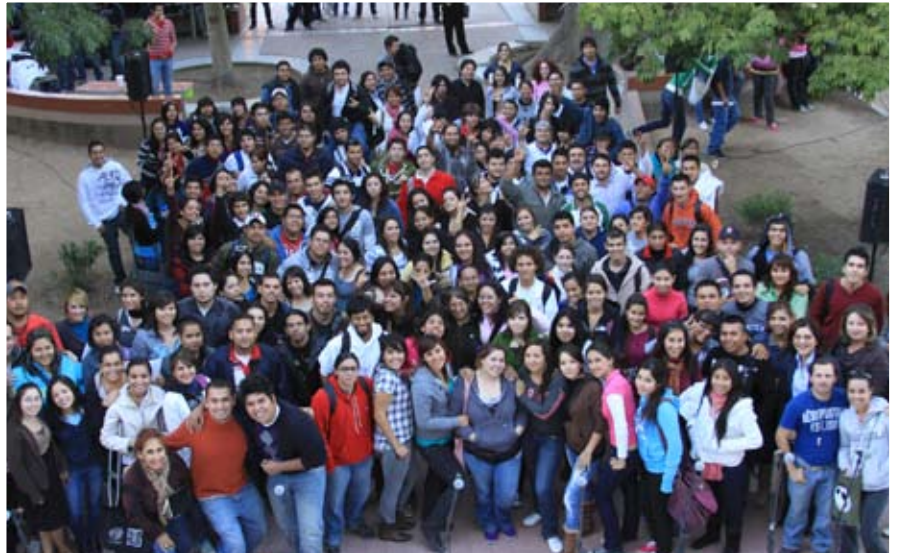
DE FIESTA LOS QUÍMICOS EN SU DÍA