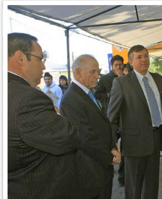
Autoridades en recorrido por los stands.

En su mensaje el rector destacó que la octava edición de la Feria de la Creatividad y Vinculación Universitaria es un espacio en el cual los estudiantes demuestran su iniciativa, creatividad y vocación emprendedora me-