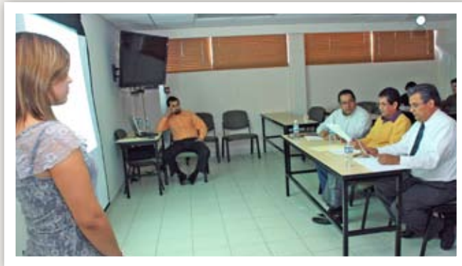
Recientemente hubo presentación de avances de tesis de los estudiantes de la Maestría en Innovación Educativa.

tiene duración de dos años y quienes lo cursan deben dedicarse a él de tiempo completo. La académica explicó que lo que se busca es formar profesionales con perfil de investigadores, sobre todo en trabajos enfocados a la problemática en la educación y la innovación en este mismo ámbito. "Nuestro reto es dar una formación humanista, que los estudiantes se sensibilicen por la educación en todos los sentidos y enfoquen sus trabajos de investigación hacia la detección de problemas prioritarios en nuestro país sobre este tema", señaló. La maestría tiene un núcleo básico de diez académicos, y complementan la planta docente profesores invitados, tanto de instituciones del país, como de otras divisiones de la alma máter, concluyó la coordinadora.