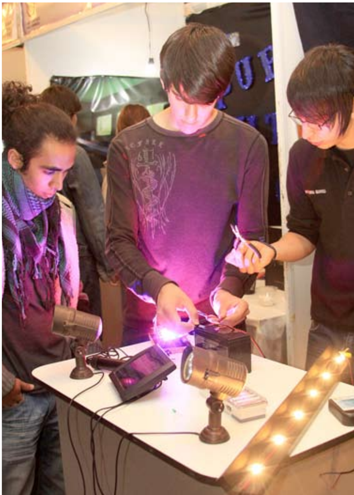
TECNOLOGÍA Y CREATIVIDAD.