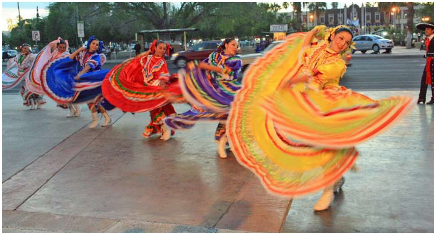
ARMAN UN "FANDANGO".