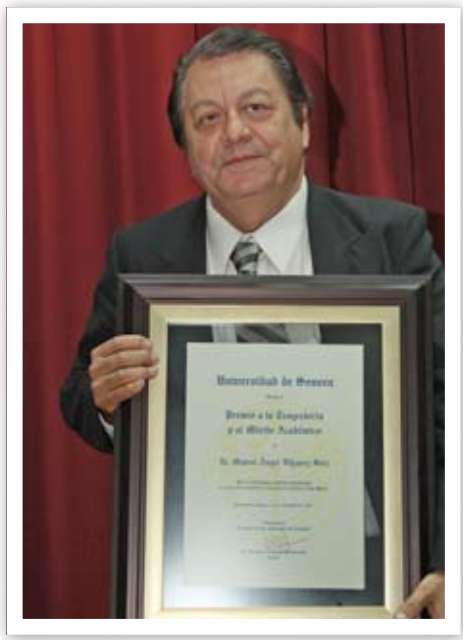
El docente e investigador muestra orgulloso su placa de reconocimiento.