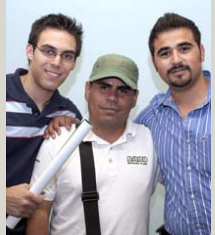
Ganadores en la ceremonia de premiación del concurso.