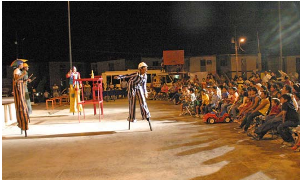
Sacar la Universidad a la calle, uno de los compromisos cumplidos.

educación superior en el estado no podemos tener un campus en cada ciudad, pero sí tenemos que pensar en ello; por eso, debemos avanzar en la parte de educación a distancia, y tenemos que hacerlo junto con la sociedad. Hemos comenzado con el lanzamiento de la licenciatura en Trabajo Social completamente a