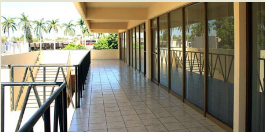
Instalaciones provisionales que albergarán a los estudiantes de la Universidad en Cajeme.