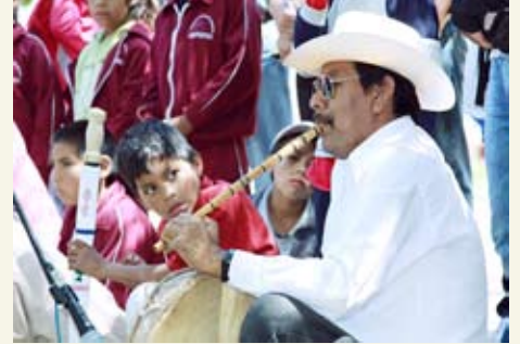
Niños y adultos de Vicam dieron muestra de su cultura en la Universidad.

Posteriormente, tres niños ejecutaron la tradicional Danza del Venado, misma que se ejecuta durante el Sábado de Gloria.