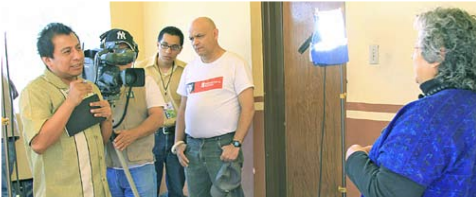
Grabación del programa "De raíz luna..." , de Canal 22, dentro del campus.