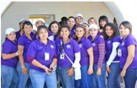
Estudiantes que participaron en esta intervención comunitaria.