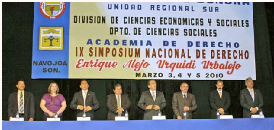
Mesa del presidium durante la inauguración del evento.