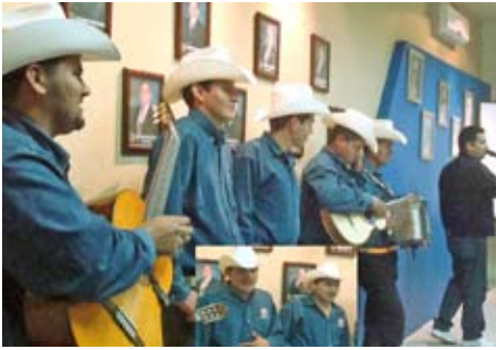
Hubo presentación artística.