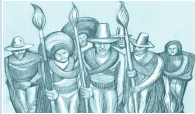
Ilustración: Raúl Roberto Ruiz García

La opinión de los articulistas no refleja necesariamente el criterio de este órgano informativo de la Dirección de Comunicación.