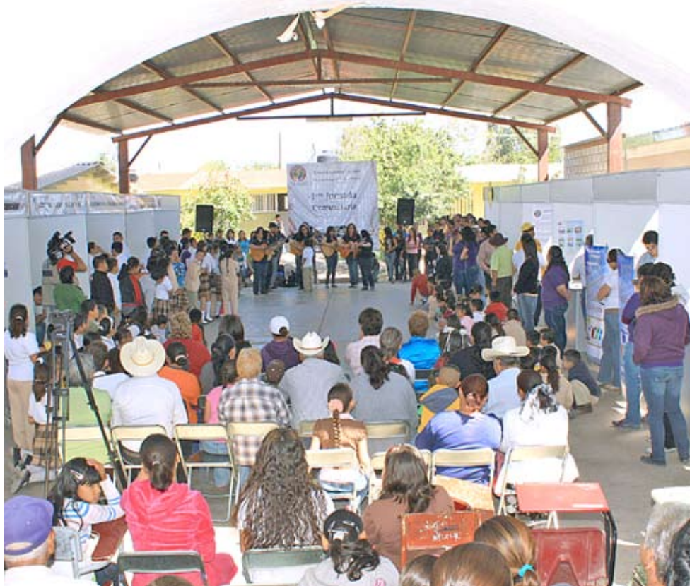
La escuela primaria Emilio Carranza fue sede de esta jornada que tuvo muy buena aceptación por parte de los pobladores de Estación Zamora.

Añadió que es importante para la Universidad tener esta vinculación, coordinarse con diferentes instituciones y aunque esta es la primera jornada comunitaria confía en que haya otras más.