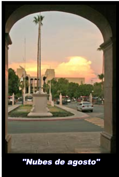
"Nubes de agosto"