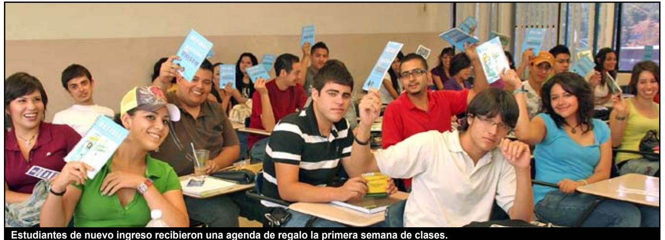
Estudiantes de nuevo ingreso recibieron una agenda de regalo la primera semana de clases.

Puntualizó que los detalles de esta investigación ya fueron entregados a cada uno de los responsables académicos de las licenciaturas para que tomen decisiones al respecto, mientras que a nivel institucional también se hará lo conducente.