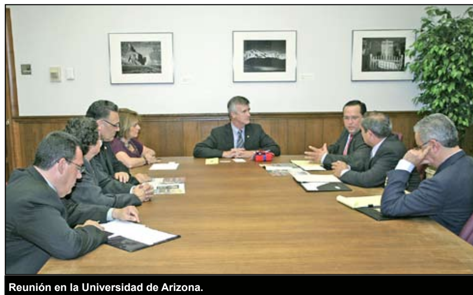
Reunión en la Universidad de Arizona.