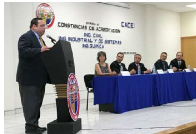
Durante la ceremonia de reacreditación.